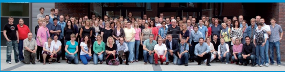
Kollegium des LBK